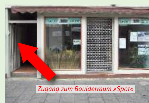
Zugang zum Boulderraum »Spot«