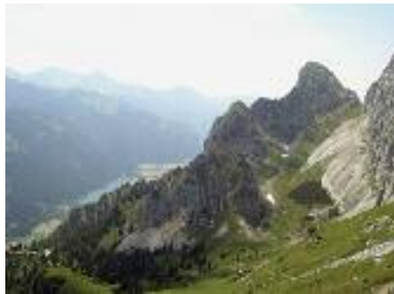
Gimpelhaus, Haldensee, Hochwiesler, Rote Flüh, Gimpel

Das Gipfelglück war uns hold mit Gipfeljause und Gipfelschokolade und sonnigen Ausblicken auf das Tannheimer Tal.