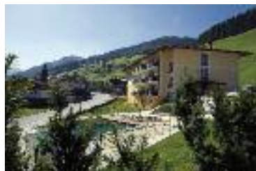
Aparthotel mit Schwimmteich

Genießen Sie perfektes Panorama, Komfort und familiäre Gastlichkeit.