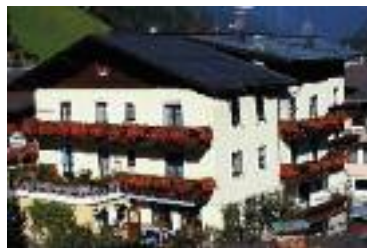
Hotel Almrösl im Sommer