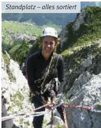
Standplatz – alles sortiert