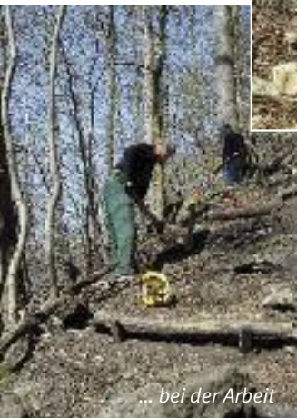
... bei der Arbeit

Glücklicherweise konnte im März ein neuer Vorstand gewählt werden.