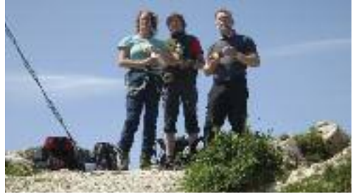
Wo klettert der denn lang - da ist doch keine Route.

Wir hingegen trudelten zeitig genug beim Gimpelhaus ein und ließen uns von einem unserer Lieblingskellner Apfelstrudel mit Vanillesoße bringen – und natürlich auch ein großes Radler. Letzteres – auch ein Tipp unseres erfahrenen