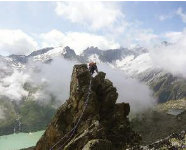
Am Südgrat Hochschijen