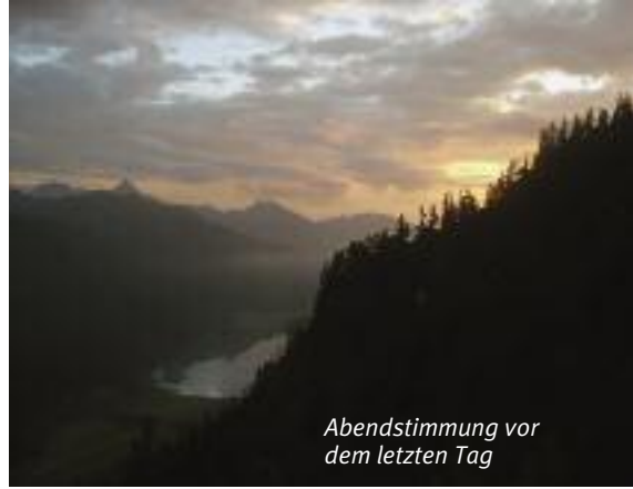
Abendstimmung vor dem letzten Tag