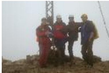
Rote Flüh mit fachgerecht getapeten Wanderschuhen

Am zweiten Tag sollte es der Hüttengrad sein, fünf Seillängen, und das Wetter ließ uns in Trockenheit wiegen. Frohlockend sind wir vier Seillängen überschlagend hochgeklettert, als es zu schütten begann. Unerreichten Gipfelglücks seilten wir ab, begleitet von Blitz und Donner; wir waren bereits bis auf die Haut nass, kalt und klamm, unten endlich angekommen, fand ich meine Stiefel aufrecht stehend am Felsfuß, literweise gefüllt mit Wasser.