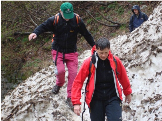
Altschnee im Val di Prato

Bis etwa eine Woche vor unserem Abfahrtstermin war das dort auch so. Aber je näher der Termin kam, desto mehr entfernte sich die Wetterprognose vom langjährigen Mittel. Und zwar nach unten! Zuletzt sollte es nur noch regnen bei 10°C. Toll! Was tun? Hektische Telefonate, Ausweichziele suchen, immer wieder die neuesten Wetterberichte lesen. Für die ganzen Alpen waren die Berichte gleich.