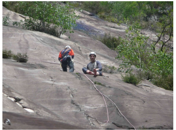
Auf den Platten von Tegna