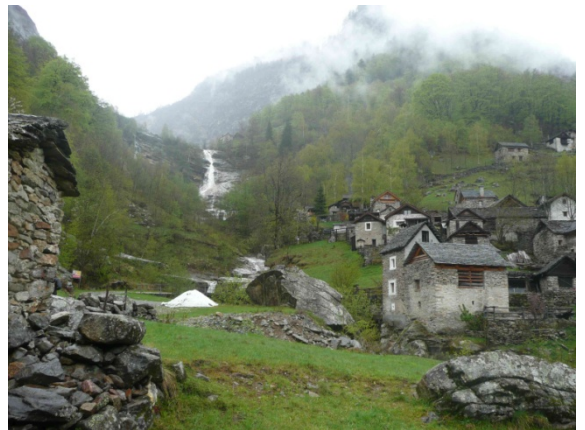
Wanderung ins Val di Prato

Dienstag wieder der Dauerregen. Anorak, Regenhose und Rucksackhülle waren angesagt. Wir wollten uns ein neues Klettergebiet im oberen Maggia-Tal bei Prato anschauen. Schönes Gebiet, aber auch schön nass. Dann noch eine kleine Wanderung ins Val di Prato, vorbei an kleinen rustikalen Siedlungen und schönen Wasserfällen.