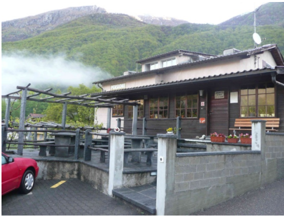
Unsere Pension in Gordevio