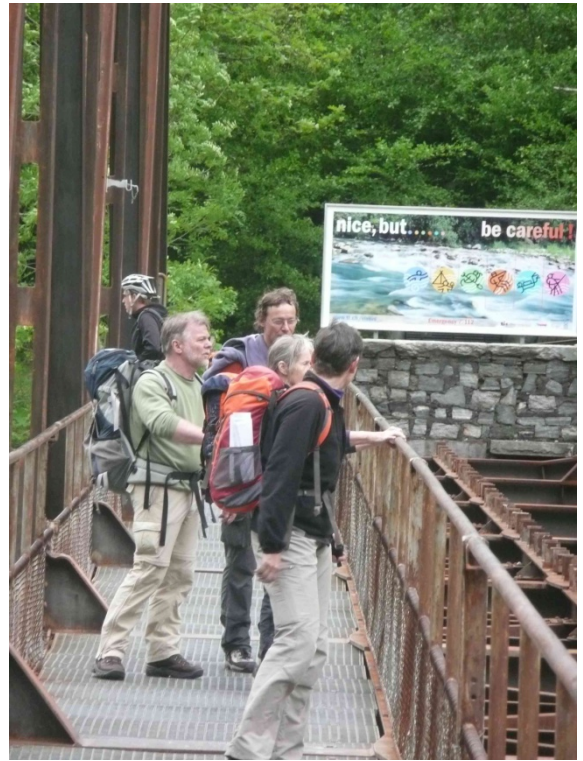
Brücke über die Maggia

Wir hatten vom Regen jetzt allerdings genug. Und an den nächsten Tagen sollte sich das Wetter auch nicht ändern. Nach einem ausgiebigen Abendessen mit Rotwein aus dem Tessin entschlossen wir uns schweren Herzens unseren Urlaub abubrechen und am nächsten Tag wieder heim zu fahren. Schade, aber vielleicht klappt das mit dem Wetter beim nächsten Mal.