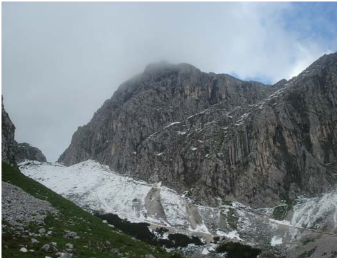
Weg zum Westgrat

Während für Göttingen das schönste Sonnenwetter prognostiziert wurde, machten wir uns morgens um 4.00 Uhr auf den Weg in die Tannheimer Alpen, um (unfreiwillig) den Regen zu suchen. Nach 550 km mit dem Auto und 550 Höhenmeter zu Fuß gelangten wir um 11.00 Uhr am Gimpelhaus.