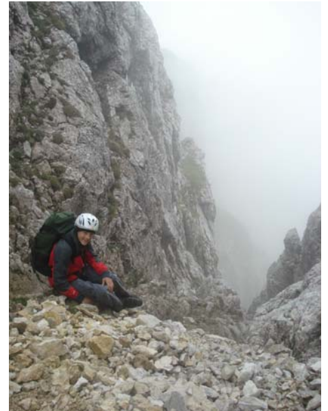
Wanderweg zur Kellenspitze

Der fünfte Tag sollte der Abreisetag sein – die Sonne schien: hey, dann noch die Till Anne vor der Heimreise? Schöne Kletterei, aber die Zeit war zu knapp, um die Route zu Ende zu klettern. Stattdessen: Einmal auf der Terrasse vom Gimpelhaus im Sonnenschein einen Apfelstrudel genießen – wie hatten wir uns das bloß verdient?