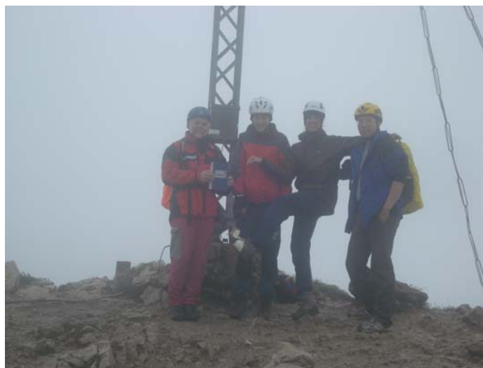
Gipfelbild - Rote Flüh mit fachgerecht getapeten Wanderschuh

Als wir am dritten Tag aufstanden, befand sich das Gimpelhaus in einer einzigen Wolke. Dazu Niesel, später strömender Regen... Nachmittags konnten wir uns wandernd zum Gipfel der Roten Flüh