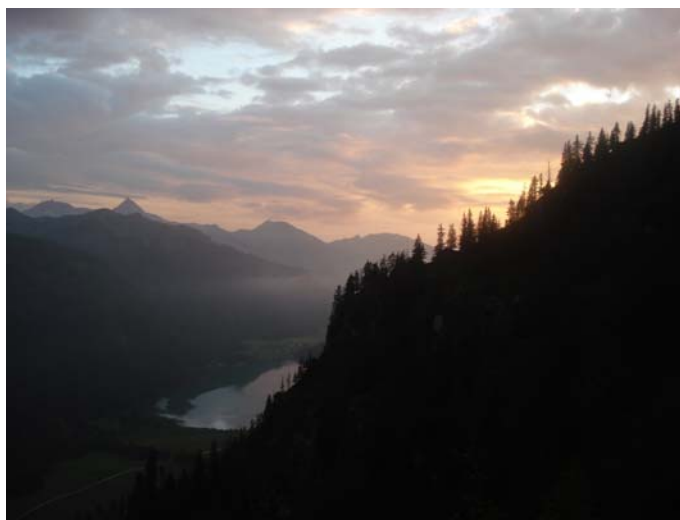
Abendstimmung vor dem letzten Tag