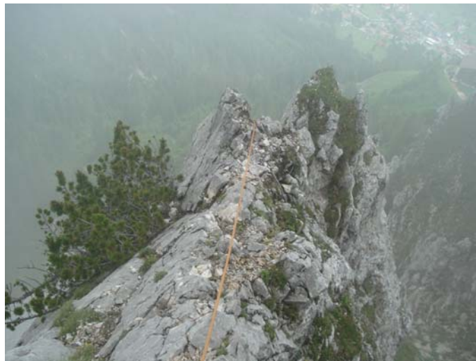
vierte Seillänge des Hüttengrats

Am zweiten Tag sollte es der Hüttengrad sein, fünf Seillängen, und das Wetter ließ uns in Trockenheit wiegen. Frohlockend sind wir vier Seillängen überschlagend hochgeklettert, als es zu schütten begann. Unerreichten Gipfelglücks seilten wir ab, begleitet von Blitz und Donner; wir waren bereits bis auf die Haut nass, kalt und klamm, unten endlich angekommen, fand ich meine Stiefel aufrecht stehend am Felsfuß, literweise gefüllt mit Wasser.