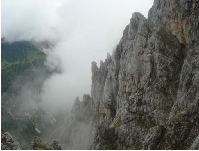
Weg zur Kellenspitze

Auch der vierte Tag ließ uns nicht trockenen Fußes die Kellenspitze erreichen. Die „Klappschuhe“ zerlegten sich bei der Wanderung vollends und mussten durch Kletterschuhe ersetzt werden. Und: Der wohlverdiente Apfelstrudel mit Vanillesoße war, am Gimpelhaus angekommen, bereits aus und musste durch Sachertorte ersetzt werden.